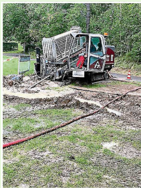
Aufwendig im Spülbohrverfahren wurde die Wasserleitung nach Dätzingen verlegt. Landesstraße, Schwippe und Würm mussten unterquert werden.

tungen für Überlaufbecken, aber auch die Sanierung des Kanalnetzes aus der Eigenkontrolluntersuchung. Sie wollen Gebühren sparen? Wer Flächen seines Grundstücks entsiegelt, fördert nicht nur die Umwelt, sondern kann auch Niederschlagswassergebühren sparen, wenn die Flächen der Gemeinde dann gemeldet werden. Aber auch so ist jede Investition im Abwasserbereich eine Investition für den Umweltschutz. Gerne können Sie auch weitere Informationen bei der Zweckverbandssitzung der Wasserversorgung und für das Klärwerk am kommenden Donnerstag, 24.06.2021 um 19.00 Uhr im Graf-Ulrich-Bau erhalten.