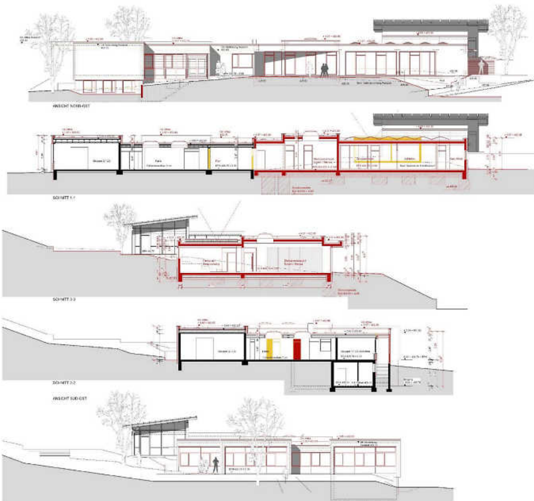
Verschiedene Ansichten wie die beiden Gebäude künftig zusammengebaut sind