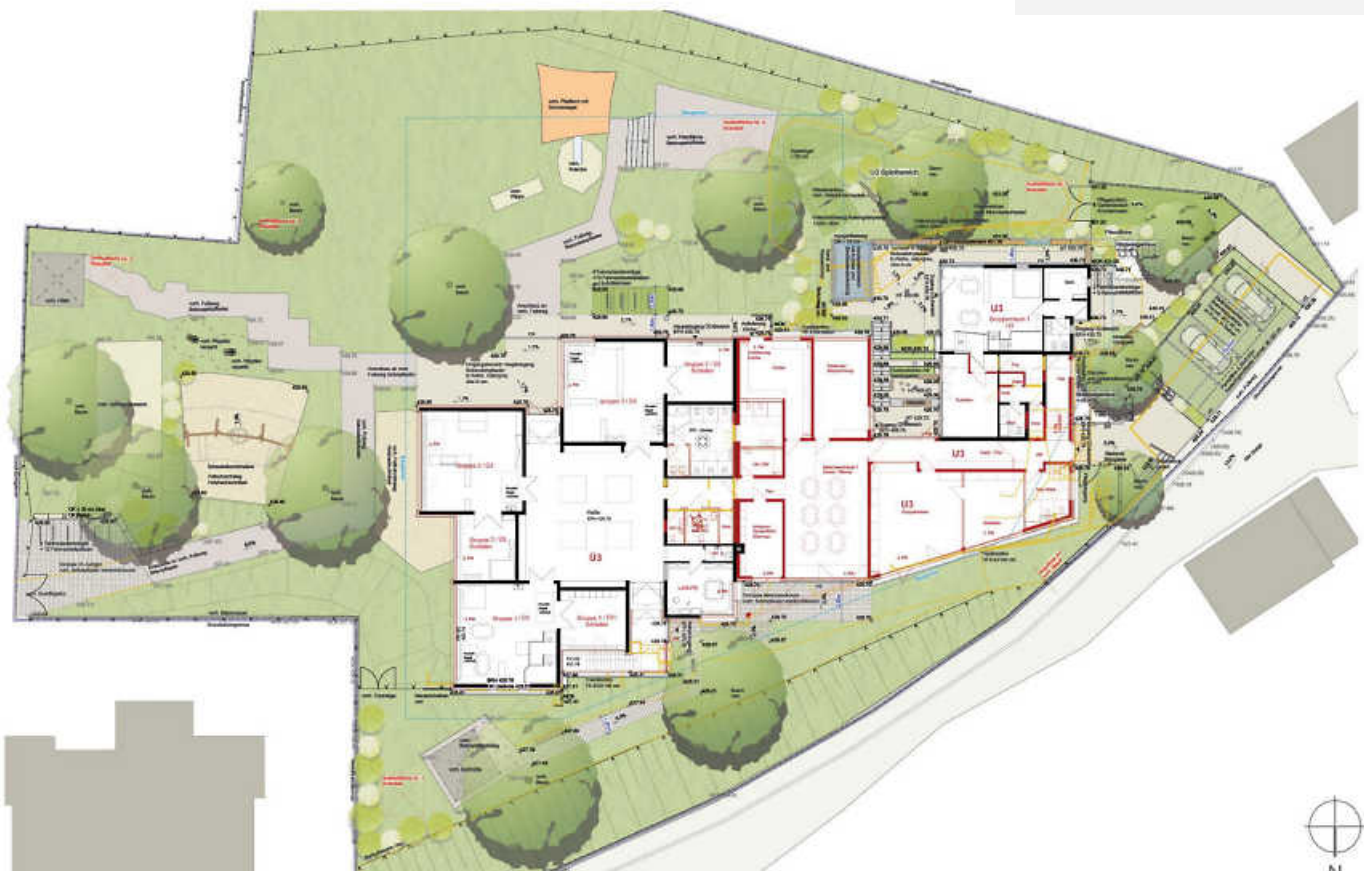
Der Zugang über den Auinger bleibt, der Zugang von der Steige wird barrierefrei und dient künftig für die 2 Gruppen im westlichen Teil des Gebäudes.