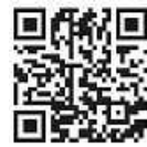
Grafik: Steffen Epple

Die Frage ist, wer sind unsere Nächsten? Meine Freunde, die Nachbarin, der Bettler auf der Straße oder die Geflüchteten aus Afghanistan? Ich glaube diese Frage müssen wir jeden Tag neu beantworten und dann spontan entscheiden. Vielleicht ist es dran für die Verfolgten zu spenden, zu beten oder sich Zeit für einen Freund zu nehmen, der mich gerade braucht. Denn ich glaube, es kann viel geschehen, wenn wir mit offenen Augen und einem weiten Herz durch die Welt gehen.