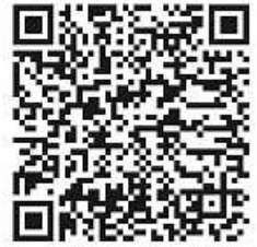
Wahlscheinantrag für Mobilgeräte

Nur ausfüllen, unterschreiben und absenden, wenn Sie nicht in Ihrem Wahlraum, sondern in einem anderen Wahlbezirk Ihres Wahlkreises oder durch Briefwahl wählen möchten. Wahlberechtigte mit Behinderungen können sich der Hilfe einer anderen Person bedienen.