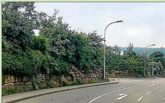
Am Ortseingang: Lärmschutz und Ökologie elegant verbunden