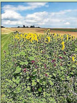
Blühflächen für Insekten – im Außenbereich aber auch im Ortsbereich

Diese Darstellung des Istzustands im Nachhaltigkeitsbericht ist sicher nicht vollständig. Aber er zeigt auch auf, dass Städte und Gemeinden in etlichen Bereichen schon vom Gesetz her zur Nachhaltigkeit verpflichtet sind und darüber hinaus wie Grafenau eigenständig sehr wohl ökologische und energetische Umwelt- und Naturschutzprojekte verfolgen. Der Nachhaltigkeitsbericht wurde in der vergangenen Sitzung des Gemeinderats behandelt und im Sitzungsbericht wird hier im Mitteilungsblatt darüber berichtet.